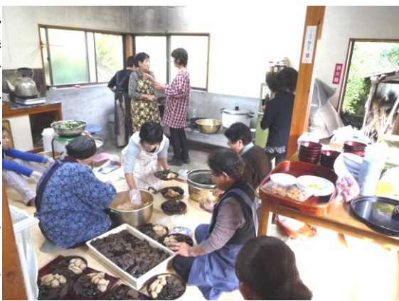
お勝手 前日からコンニャク、