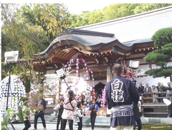
境内では纏が舞い、太鼓が響き、